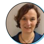
Anne POSTIC Commissaire à la prévention et à la lutte contre la pauvreté