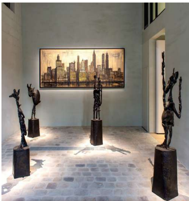
Ouverture du Musée Cligman à l'abbaye de Fontevraud (49)

Inauguré le 18 septembre 2021, le musée d'art moderne de Fontevraud - collections nationales Léon et Martine Cligman, a été labellisé musée de France. L'État a apporté son concours technique et scientifique à l'opération ainsi qu'une contribution financière de 500 000 €