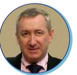
Benoît BROCARD Préfet de la Vendée (jusqu'au 22 novembre 2021)