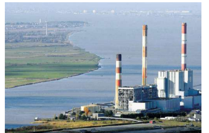
Centrale de Cordemais

À signaler en 2021, l'agrandissement du port de La Turballe pour la maintenance des parcs éoliens en mer, des transports en communs en site propre et le réseau de chaleur de la CARENE, des projets du Port.