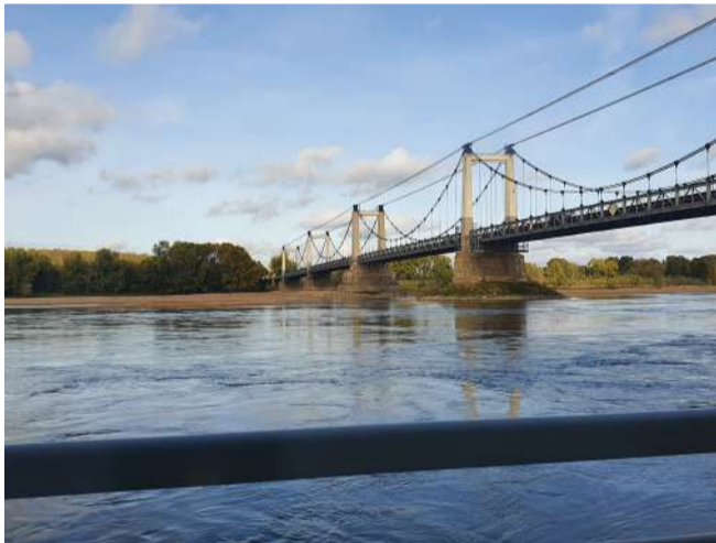
Restauration écologique de la Loire

Enfin, 8 territoires se sont engagés dans des démarches de Projet de Territoire pour la Gestion de l'Eau pour atteindre, sur la durée, un équilibre entre besoins et ressources disponibles.