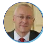
Pierre ORY Préfet du Maine et Loire