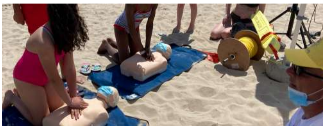
Le BeachTour a été l'occasion pour les agents de l'État d'aller directement parler aux jeunes.

• 3000 jeunes se sont engagés en 2021 dans une mission de service civique.