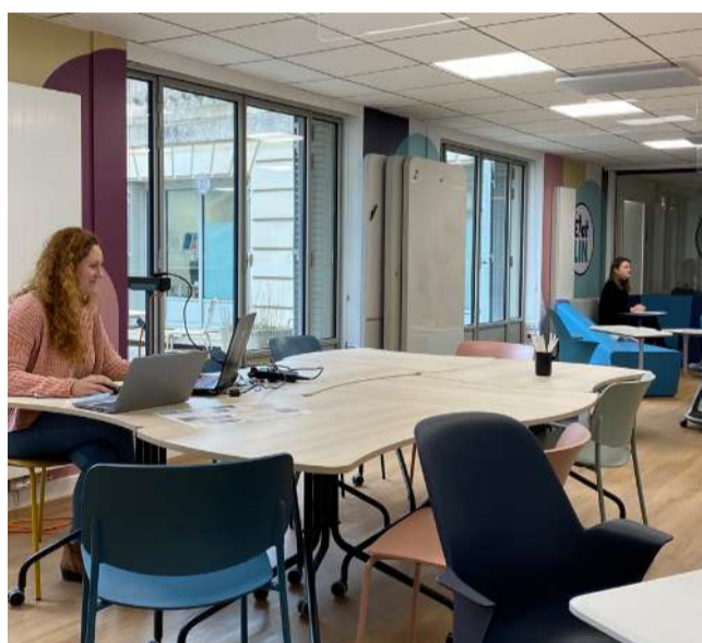
Le lab' est un espace de travail modulaire conçu pour expérimenter de nouvelles postures de travail et favoriser les échanges collaboratifs.

Dans le cadre du Mois de l'innovation Publique, les nouveaux locaux d'État'LIN, le laboratoire d'innovation publique en Pays de la Loire, ont été inaugurés le 23 novembre.