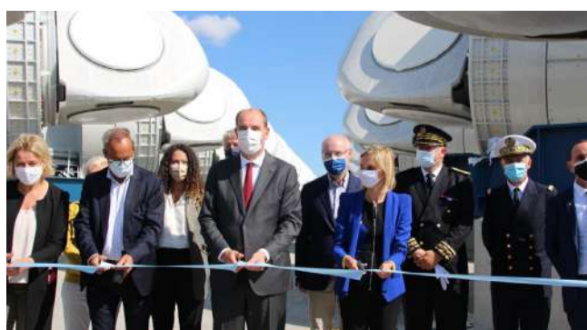
Le Premier ministre accompagné de la ministre de la Transition écologique et de la ministre déléguée auprès du ministre de l'Économie.

Le hub pour les éoliennes en mer du Grand Port Maritime de Nantes Saint-Nazaire est prêt depuis janvier 2021. Premier du genre en France, il permet le stockage et le pré-montage des éoliennes pour le parc du grand banc de Guérande, au large du Croisic. Le Premier ministre, Jean Castex, s'est rendu sur le chantier le 28 août.