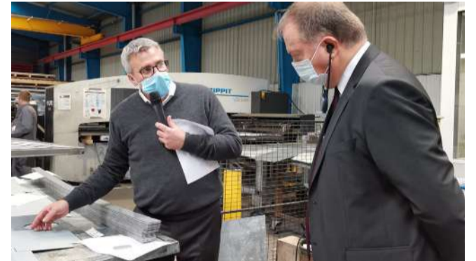
Le préfet visitant l'entreprise ABC Pliage à Nantes, accompagnée par Pôle Emploi pour former les candidats à un emploi à leur futur poste.

L'État se mobilise pour soutenir les secteurs qui peinent à recruter. Le plan gouvernemental présenté le 27 septembre se décline sur le terrain. Des feuilles de route sont élaborées dans tous les territoires de la région pour une approche concertée et localisée.