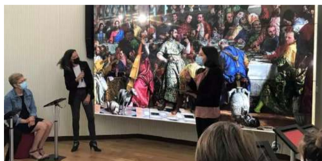
Animation de la micro-fole à Châteaubriant

11 projets de micro-folies, musées numériques, ont été soutenus en 2021 en vue d'une ouverture en 2022 pour un montant total de 345 000€. Trois micro-folies sont déjà ouvertes en Pays de la Loire : Châteaubriant (44), Allonnes (72), et Notre-Dame-de-Mont (85).