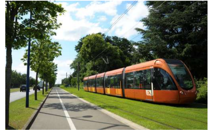
Tramway du Mans. 2,1 M€ pour le projet d'augmentation de capacité des lignes de tramway

2021 aura été une année charnière dans la promotion des transports collectifs urbains et des mobilités douces dans les territoires ligériens. 9 projets ont été lauréats de l'appel à projets « Transports collectifs en site propre », pour un montant total de 377 M€.