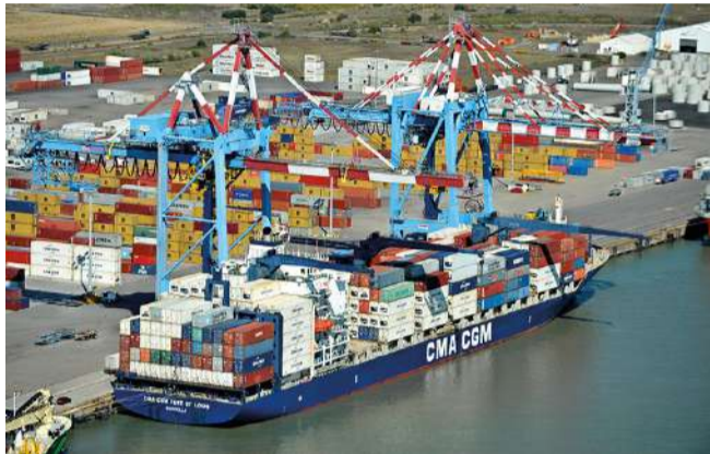
Grand Port Maritime Nantes Saint-Nazaire

Les investissements du Grand Port ont connu une accélération, à la faveur du plan de relance et du partenariat avec les collectivités : 25 M€ ont été affectés à de nouveaux projets pour diversifier les relais de croissance du port, réduire l'empreinte écologique des infrastructures portuaires et développer l'intermodalité.