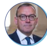
Xavier LEFORT Préfet de la Mayenne (depuis le 8 mars 2021)